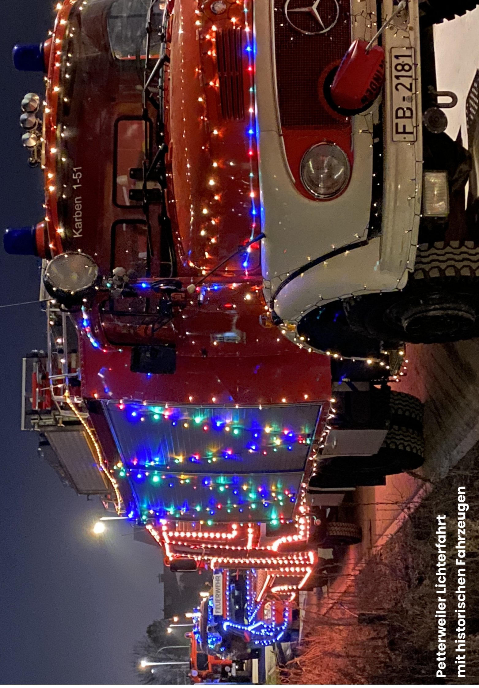
Petterweiler Lichterfahrt mit historischen Fahrzeugen