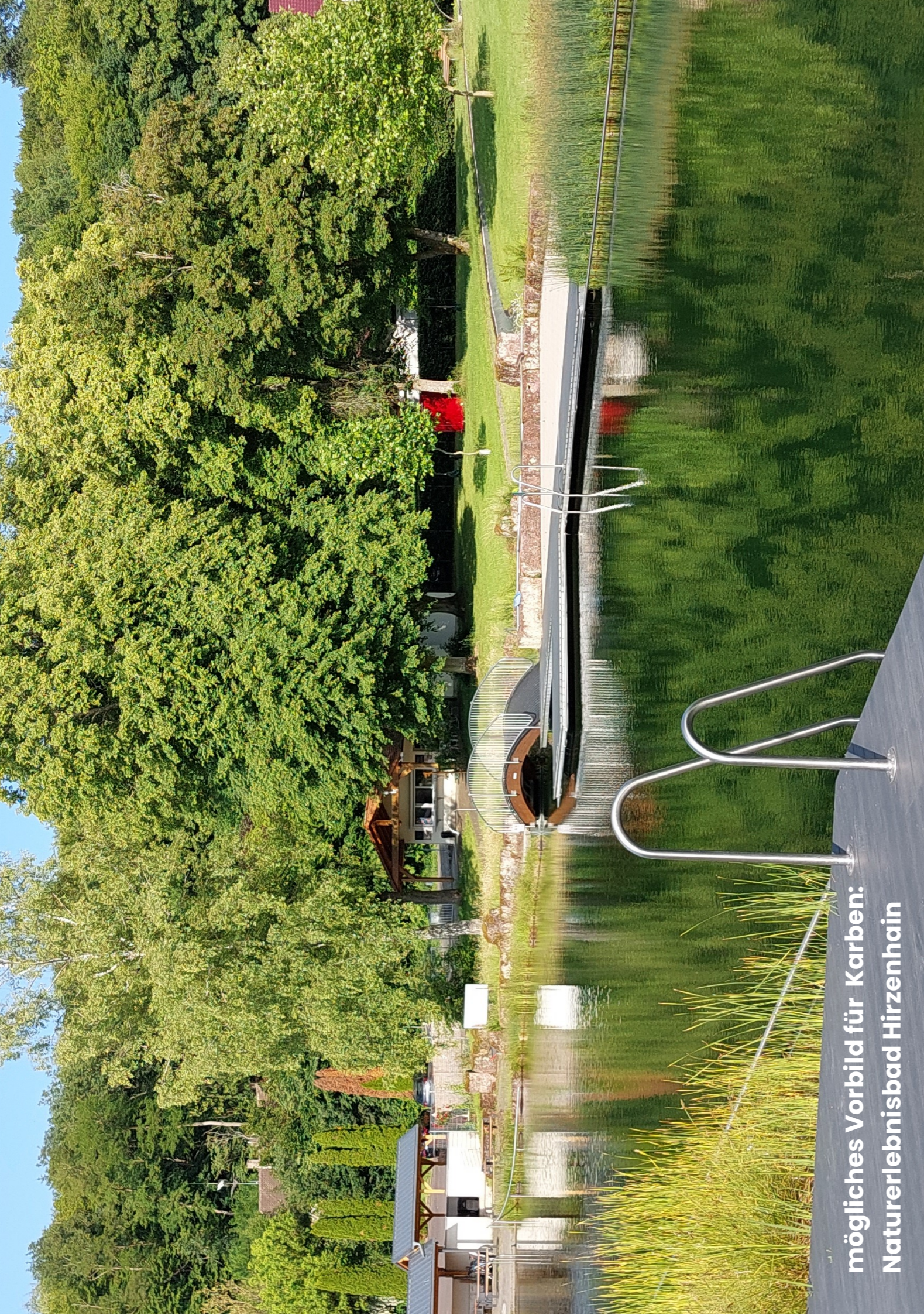
mögliches Vorbild für Karben: Naturerlebnisbad Hirzenhain